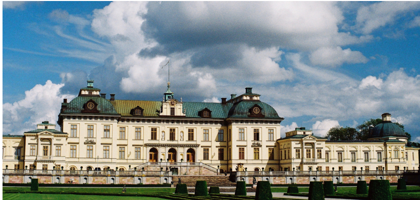
Schloss Drottningholm