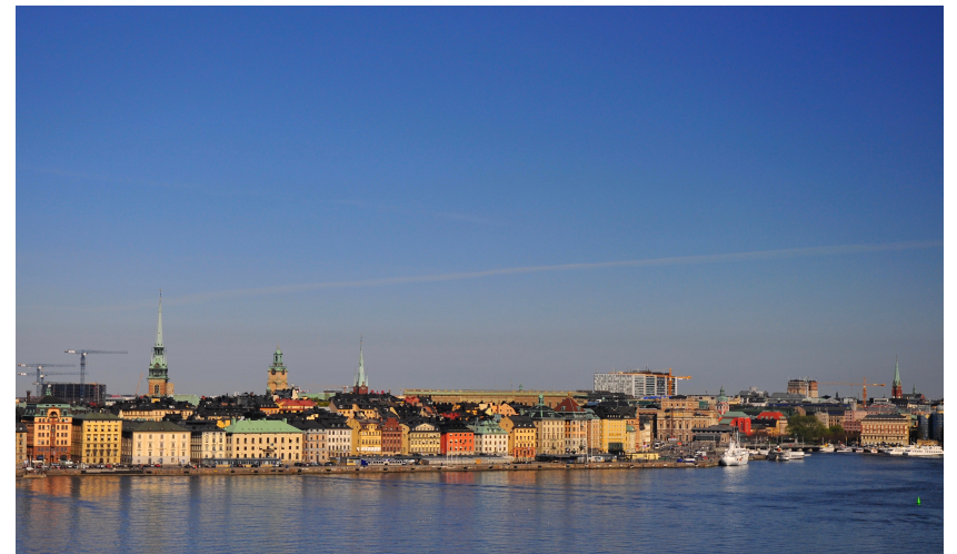
Blick auf Stockholm von der Ostsee aus

Der Dienstag steht vor allem im Zeichen von Johan Helmich Roman, dem ‚schwedischen Händel‘. Nach einer kurzen Stadtrundfahrt mit dem Bus spazieren Sie am Vormittag durch den Kungsträdgårdens (Königlicher Garten), einen Park mitten im Herzen der Altstadt, in dem sich seit dem 15. Jahrhundert bis heute die Stockholmerinnen und Stockholmer vergnügen und der bis heute lebendig geblieben ist. Entsprechend lassen sich an diesem Ort sechs Jahrhunderte Stadtgeschichte unmittelbar erleben. Auch die Umgebung des Kungsträdgårdens erkunden Sie mit Hans Joerg Zumsteg. Nach dem Mittagessen erhalten Sie im Nationalmuseum eine private Führung zur schwedischen Malerei der Zeit Händels und Romans. Gegen Ende des Nachmittags erleben Sie nach einer Einführung von