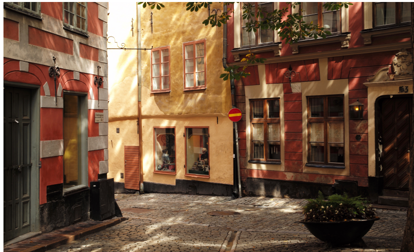
In Stockholms Altstadt Gamla Stan