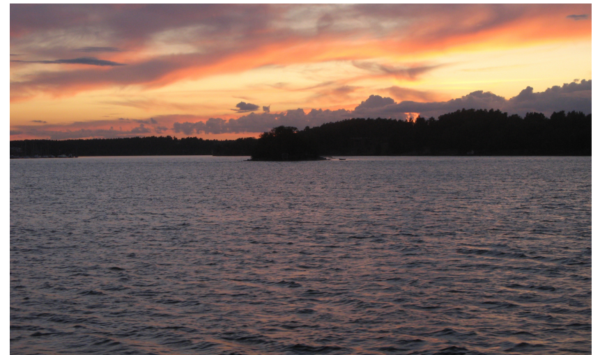
Abendliche Dinnercruise durch Stockholms Schärengarten (Ostsee)